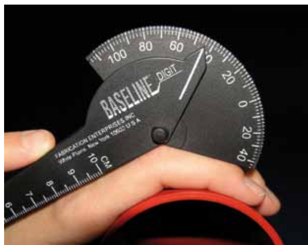
Gedoseerde flexie PIP-gewricht.

Zolang er in Nederland geen erkende specialistenregisters voor handtherapeuten bestaan en de titel 'handtherapeut' niet beschermd is, blijft het lastig om te bepalen wie wel of niet over voldoende kennis en ervaring beschikt om een aanpak aan een hand goed te behandelen. Als verwijzer kan je wel kijken of de therapeut het CHT-NL-certificaat heeft. Dit is een individueel certificaat en geen praktijkerkenning! De NVHT laat op haar website, via een overzichtelijke kaart, alle praktijken in Nederland zien waar ten minste één gecertificeerde handtherapeut werkt.